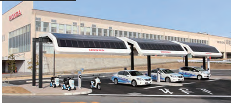
本田技研工業株式会社 熊本製作所

将来の水素社会実現を目指し、Hondaの高圧水電解技術を生かしたソーラー水素ステーションと大容量発電機能を持つFCVを組み合わせ、CO2排出ゼロを目指していきます。