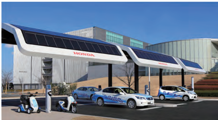
本田技研工業株式会社 和光本社